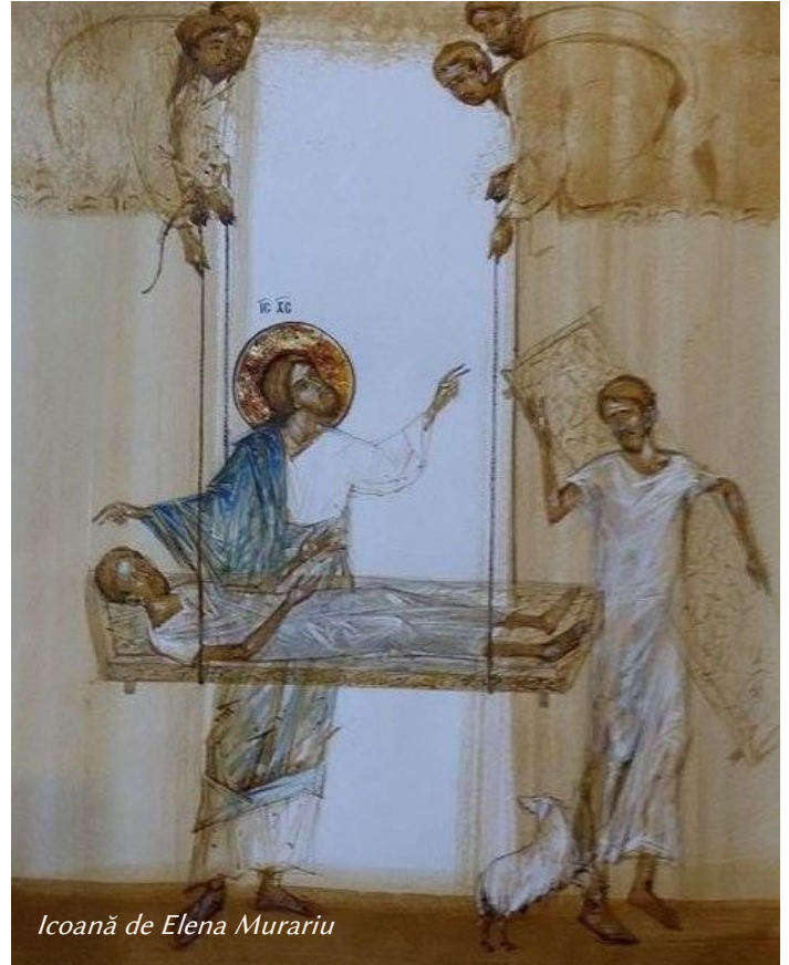
Icoană de Elena Murariu

2 Nu te întrista pentru mine, copilul meu, ci luptă plin de râvnă. Luptă în tăcere, cu rugăciune și căință , și vei afla, astfel, cele necesare vieții celei veșnice. Nevoiește-te: ține-ți gura închisă atât la bucurie, cât și la întristare. Acesta este un semn al experienței dobândite, așa încât ambele stări să fie păstrate neîntinate. Căci gura nu știe cum să păzească comorile. Tăcerea este cea mai mare și mai rodnică virtute; din acest motiv de Dumnezeu purtătorii Părinți o numeau fără de păcat. Tăcerea și liniștea, unul și același lucru. (Continuare în pag. 2)